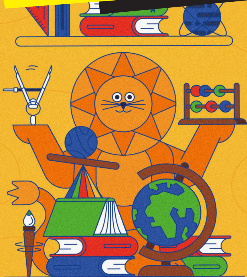
Illustration © Maison Tangible